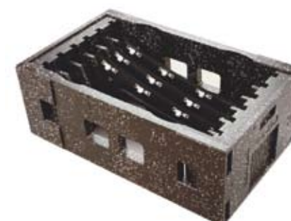
Excelente resistencia a la absorción de agua